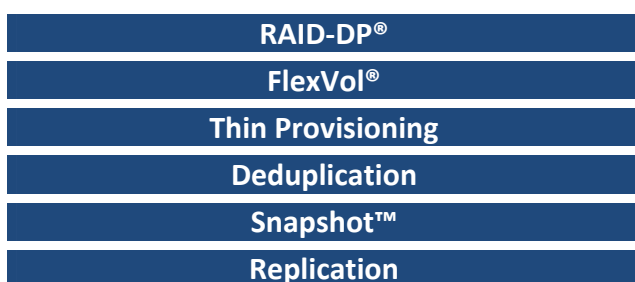
Рис. 1) Технологии NetApp, повышающие эффективность хранения

Рисунок показывает технологические решения NetApp, направленные на повышение эффективности хранения, оптимизации хранилища и экономии пространства при интеграции их в инфраструктуру, а также снижения будущих потребностей в объемах хранения. Как правило, чем больше из этих решений применено в конкретной инфраструктуре, тем больше будет величина достигнутой экономии.